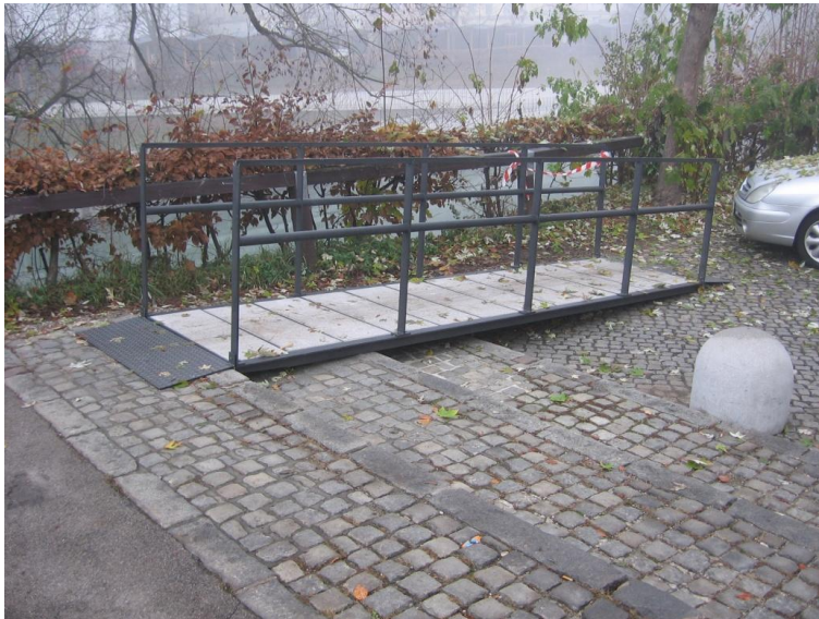
Slika 3: Montažna klančina na Gallusovem nabrežju

V letu 2012 so bila nižanja robnikov na javnih prometnih površinah izvedena na sledečih lokacijah: