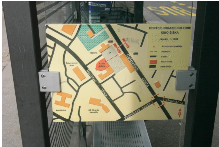
Slika 5: Tipni načrt za dostop do Centra urbane kulture Kino Šiška na postajališču mestnega potniškega prometa