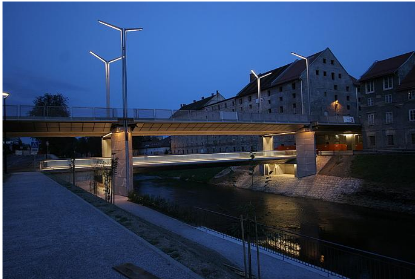
Slika 2: Fabianijev most