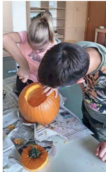
FOTOGRAFIJE OŠ DRAGOMELJ

Učenci so iz odpadnega materiala izdelali svojo štafeto, in še preden se je dvignila megla, so začeli teči. Vsak je prispeval po svoje, pretekel ali prehodil je toliko, kolikor je zmozel in hotel.