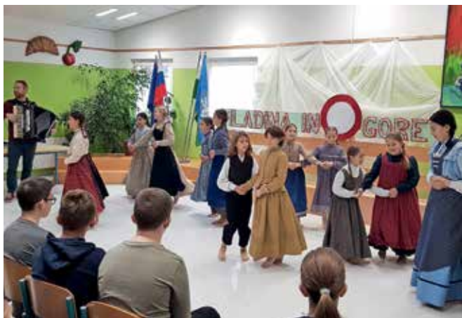
FOTOGRAFIJI OŠ MAKSA PEČARJA