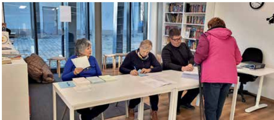
Volilna komisija v spodnjih Črnučah na referendumsko nedeljo