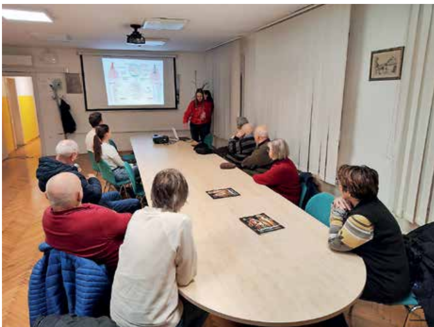
Utrinki z delavnice

Prvi del srečanja je bil namenjen nevarnosti srčnožilnih bolezni in kako se lahko temu izognemo s pravilnim življenjskim slogom, drugi del delavnice pa je bil namenjen predstavitvi temeljnih postopkov oživljanja, ki so skladni s smernicami evropskega sveta za reanimacijo. Zainteresirani so tudi v praksi preizkusili usvojeno znanje o temeljnih postopkih oživljanja s pomočjo defibrilatorja. Namen delavnic je, da očitvidci hitro in pravilno ukrepajo (masaža srca, morebitni vpihi), saj s tem pomagajo