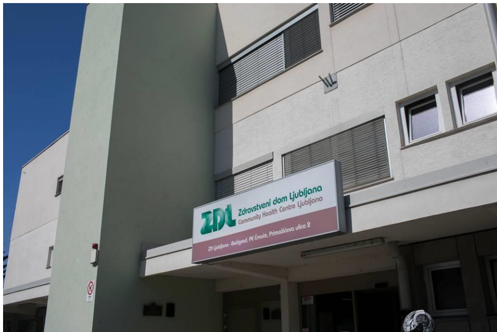
Slika 32: ZDL ves čas skrbi na dostopnost, tudi z vgradnjo dvigal

Pod okriljem ZDL od leta 2011 delujejo tudi referenčne ambulante , v katerih poleg zdravnika_ce in medicinske sestre uporabnico_ka spremlja tudi diplomirana medicinska sestra, ki spremlja kronične bolezni in izvaja preventivne ukrepe. V obdobju od 2016 do 2020 je na novo pričelo delovati 47 referenčnih ambulant. Konec leta 2020 so tako delovale 103 referenčne ambulante.