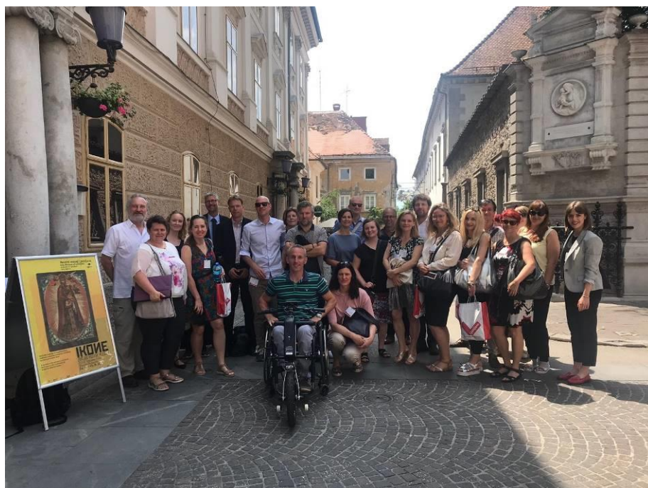
Slika 30: Srečanje EUROCITIES delovnih skupin Urbano staranje in Dostopna mesta v Ljubljani

Na podlagi navedenega so pod okriljem EUROCITIES nastale Smernice za starosti prijazna in dostopna mesta , kjer je Ljubljana zelo izpostavljena. V smernicah je Ljubljana predstavljena kot dober zgled, ki gradi na pozitivnih sinergijah med trajnostno mobilnostjo ter ohranjanjem zelenih in javnih površin. Izpostavljena je tudi kot dobitnica Evropske nagrade za zeleno prestolnico 2016, na področju prometa so izpostavljeni Kavalirji, avtobusi z nizkimi emisijami in dostopni invalidom ter prenova primestnega potniškega prometa, ki Ljubljano povezuje s sosednjimi občinami.