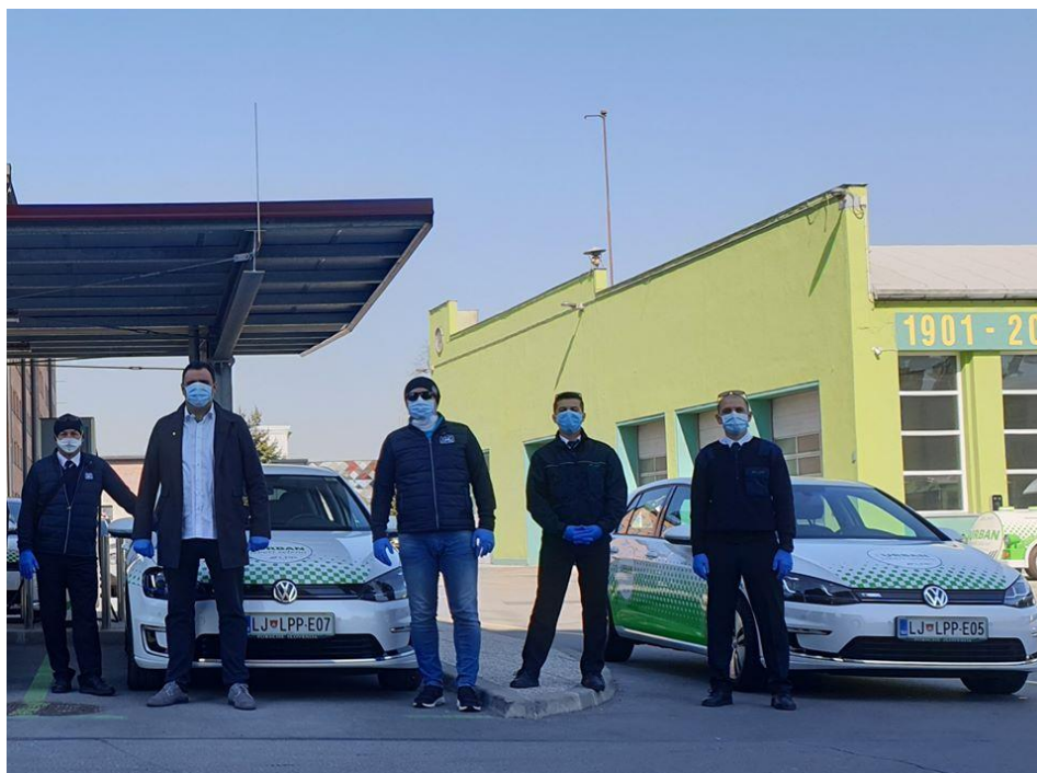
Slika 24: Vozniki LPP kot prostovoljci med epidemijo covid-19 (foto vir: spletna stran MOL)

Še posebej so se med epidemijo covid-19 izkazali tudi vozniki LPP, ki so kot prostovoljci, v organizaciji Rdečega križa Slovenije OE Ljubljana, starejšim, otrokom in drugim občanom_kam razvažali kosila, zdravila in potrebščine iz trgovin, odzvali pa so se tudi povabilu Univerzitetnega kliničnega centra Ljubljana in prostovoljno priskočili na pomoč pri logistiki, pri čiščenju in dezinfekciji postelj ter reševalnih vozil.