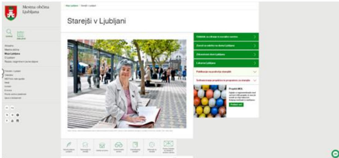
Slika 25: Zavihek Starejši na spletni strani MOL (zajem slike)

Na spletnih straneh v zavihku Starejši je objavljena tudi zloženka Za starejše, o organizacijah in storitvah s področja zdravja in socialnega varstva, ki se izvajajo v MOL , ki jo je pripravil OZSV in jo v letu 2017 vsebinsko prenovil.