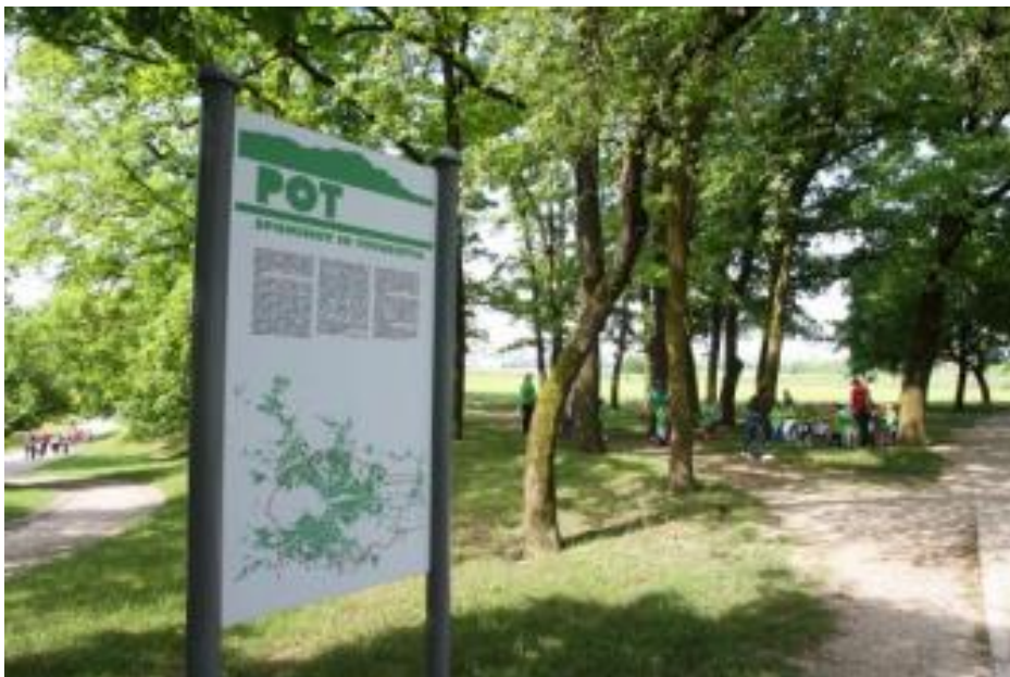
Slika 11: Pot spominov in tovarištva (foto: Nik Rován)

Animacijski športno rekreativni programi spodbujajo k starosti primernim športnim aktivnostim (pohodništvo, trim steze) ali omogočajo spoznavanje novih športnih aktivnosti (nordijska hoja). Del animacijskega programa je povezan z usmerjanjem v sistematično pripravo na množične športne rekreativne prireditve. Med najbolj množične športno rekreativne prireditve , ki jih je sofinanciral MOL, z izjemo leta 2020, zaradi epidemije koronavirusa, sodijo Ljubljanski maraton, Pohod ob žici in Maraton Franja. Vse tri prireditve imajo možnost izbire različnih dolžin, kar omogoča vključevanje različnim starostnim skupinam.