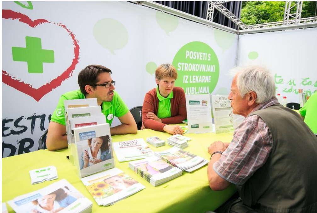
Slika 33: Strokovna svetovanja na Festivalu zdravja LL

LL je vsa leta v obdobju, na katerega se nanaša poročilo, z izjemo leta 2020 zaradi epidemije covid-19, organiziral tudi Festival zdravja , katerega rdeča nit so nasveti za zdrav življenjski slog in predstavitve preventivnih aktivnosti za zdravje in dobro počutje. V letih 2016, 2017 in 2018 je festival potekal na Gospodarskem razstavišču, v letu 2019 pa se je preselil na Kongresni trg v park Zvezda.