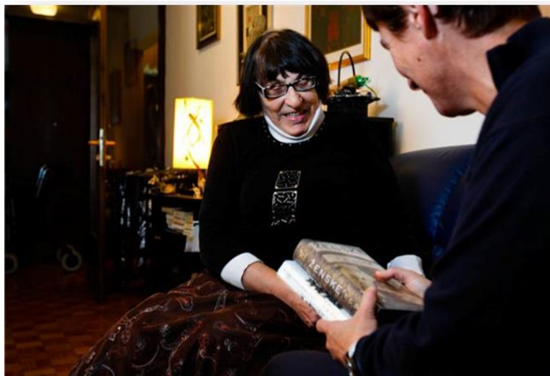
Slika 12: Servis MKL Knjiga na dom

MKL je izvajal množico aktivnosti za starejše občane_ke. V okviru servisa Knjiga na dom je enkrat mesečno omogočena brezplačna dostava in prevzem knjižničnega gradiva na domu za člane_ice, ki zaradi različnih razlogov sami težko ali sploh ne morejo obiskati knjižnice. Obiskovanje knjižničarja_ke na domu z dostavo knjig se je izvajalo redno na mesečni ravni, razen v času zaprtja knjižnic zaradi razglašene epidemije.