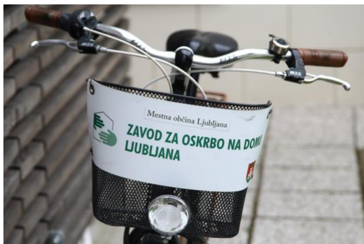
Slika 31: Oskrbovalke ZOD za dostop do uporabnikov_ic uporabljajo tudi okolju prijazna kolesa

sklenjenih dogovorov. Kljub temu, da je storitev nujno potrebna, prihaja do pomanjkanja kadrov zaradi problemov v zaposlovanju. Delo socialne oskrbovalke_ca je namreč po Zakonu o sistemu plač v javnem sektorju nizko plačano, tako da je problem dobiti kader, kar se je z uvedbo boljše plačanega osebnega asistenta še zaostri. V letu 2019 se je zaradi pomanjkanja kadra socialni servis izvajal v minimalnem obsegu, v letu 2020 pa je ZOD, zaradi epidemije covid-19 in njenih posledic, vse kadrovske potenciale usmeril v izvajanje socialne oskrbe.