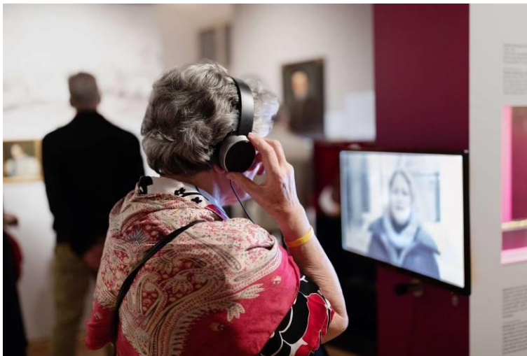
Slika 15: Mestni muzej Ljubljana skrbi tudi za dostopnost svojih vsebin

Mestni muzej Ljubljana, ki deluje v okviru javnega zavoda Muzej in galerije mesta Ljubljane, že preko 20 let organizira srečanja/skupine za starejše občane_ke, kjer starejši izbirajo različne zgodbe na vnaprej določeno temo.