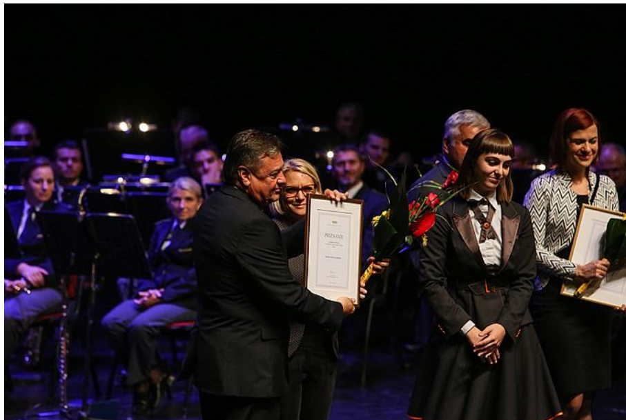
Slika 28: Prejetje priznanja za dolgoletno sodelovanje pri pripravi F3ŽO v letu 2016