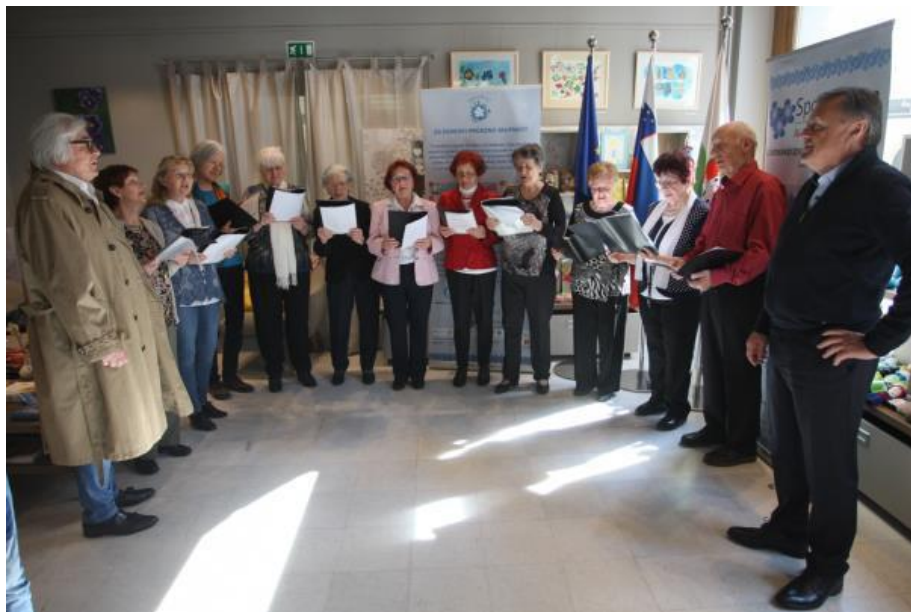
Slika 27: Utrinek z dogodka ob odprtju demenci prijazne točke v Info točki 65+

Poleg varstveno delovnih centrov, združenih v Skrbovin'co, so v obdobju, na katerega se nanaša poročilo, v prostorih Info točke 65+ svoja ustvarjalna dela razstavljale tudi skupine društev upokojencev, druga društva, redno tedensko so bile zainteresiranim na voljo tudi brezplačne preventivne meritve krvnega tlaka, srčnega utripa, glukoze, trigliceridov in holesterola.