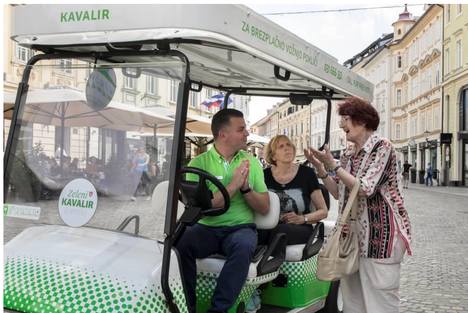
Slika 7: Električno vozilo Kavalir

oviranim osebam in turistkam_om, zaradi nizke hitrosti pa jih je mogoče ustaviti med vožnjo ali pa prevoz naročiti po telefonu. V obdobju, na katerega se nanaša poročilo, je bil izveden nakup tretjega električnega zaprtega vozila za izvajanje storitve Kavalir skozi celo leto (tudi v slabšem vremenu in ob nižjih zunanjih temperaturah), tako da so bila konec leta 2020 na voljo tri odprta in tri zaprta električna vozila Kavalir. Prevozi z zaprtimi vozili Kavalir so bili možni skozi celo leto, tudi ob neugodnih vremenskih razmerah, v letu 2019 pa je bil tudi podaljšan njihov obratovalni čas na vsak dan od 6.00 do 22.00.