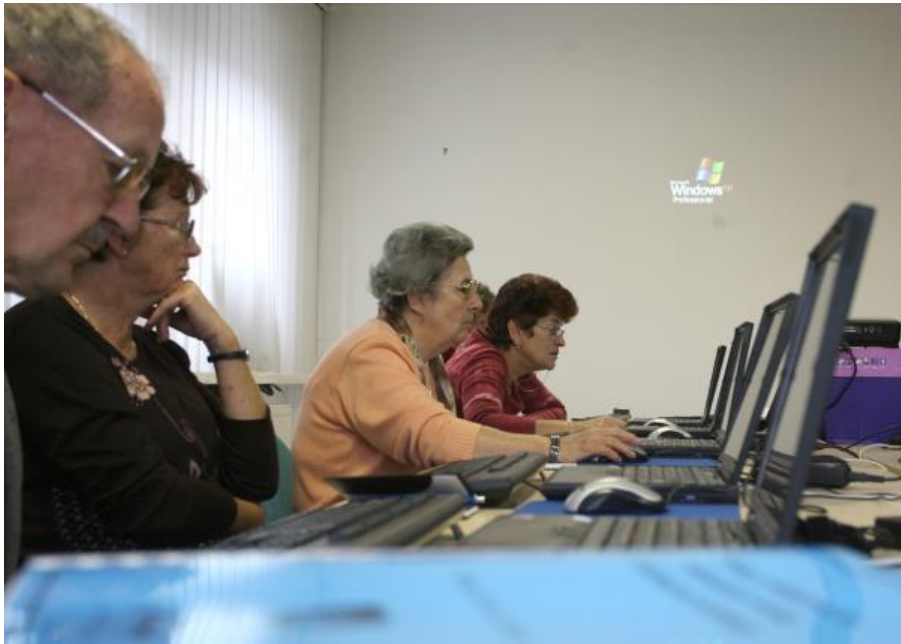
Slika 17: Brezplačni računalniški tečaji SLS za starejše prebivalke_ce MOL

SLS pa že vrsto let nudi možnost uporabe prostorov ČS MOL za izvedbo različnih dogodkov, srečanj, aktivnosti in programov za starejše, ki nepogrešljivo bogatijo vsakdan v tretjem življenjskem obdobju in jih izvajajo različne nevladne organizacije ali skupine, pa nimajo svojih prostorov.