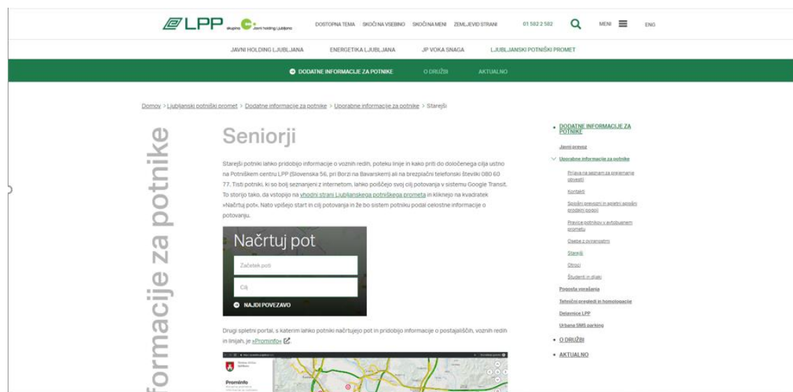
Slika 6: Zavihke Seniorji na spletni strani LPP (zajem slike)

LPP je skrbel tudi za redno informiranje starejših o uporabi mestnega linijskega prevoza potnikov z izdajo publikacij, s posebnim zavihkom Seniorji in z aktualnimi objavami na spletnih straneh LPP, upokojenkam_cem in starejšim od 65 let pa je bil omogočen nakup cenovno ugodnejših mesečnih vozovnic.