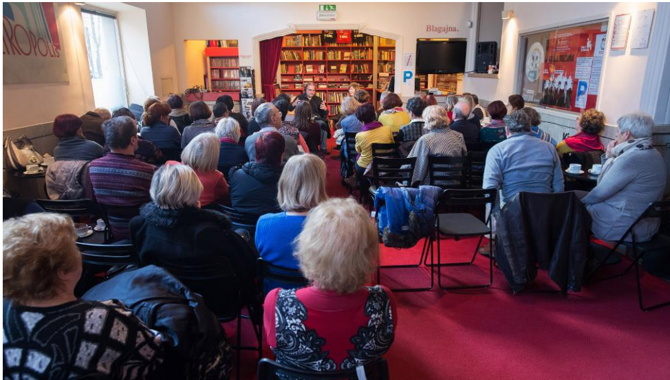
Slika 14: Filmska srečanja ob kavi, abonma za poznejša leta – pogovor po ogledu filma

Lutkovno gledališče Ljubljana je izvajal projekt Lutke povezujejo in uvedel dopoldanske termine za starejše.