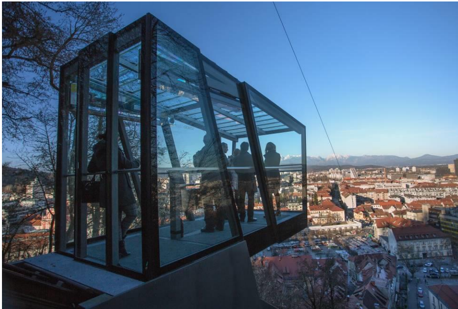
Slika 8: Tirna vzpenjača na Ljubljanski grad