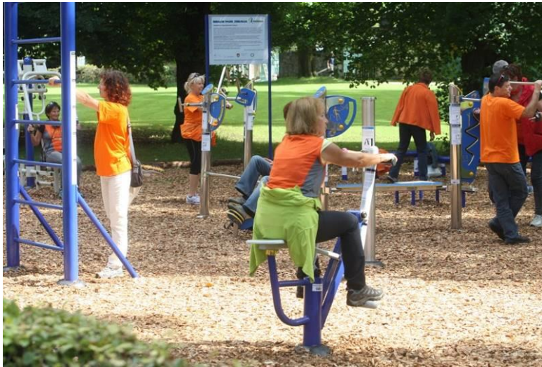
Slika 3: Otvoritev fitnesa na prostem (foto: Nik Rován)

V obdobju, na katerega se nanaša poročilo, je bilo na novo postavljenih 34 otokov športa z napravami za ulično vadbo, pet trim otokov, nova trim steza v Črnučah in 18 miz za namizni tenis na prostem. Seznam vseh otokov športa in trim stez je dostopen na spletnih straneh pod zavahkom Šport, kjer je dostopna tudi spletna aplikacija rekreacijske infrastrukture v Ljubljani z digitalnim zemljevidom Sprostite se na prostem , ki razkriva lokacije več kot 500 brezplačnih rekreativnih površin na prostem v MOL. Uporabniki ce zemljevida lahko filtrirajo prikazovanje mestnih gozdov, parkov, športnih površin, otroških igrišč, kolesarskih ali sprehajalnih stez in še nekaterih drugih oblik brezplačne rekreacije.