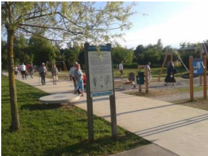
Slika 4: Večgeneracijski park ob Koseškem bajerju z igrali, primernimi tudi za starejše

V obdobju, na katerega se nanaša poročilo, je bilo na novo postavljenih 34 otokov športa z napravami za ulično vadbo, pet trim otokov, nova trim steza v Črnučah in 18 miz za namizni tenis na prostem. Seznam vseh otokov športa in trim stez je dostopen na spletnih straneh pod zavahkom Šport, kjer je dostopna tudi spletna aplikacija rekreacijske infrastrukture v Ljubljani z digitalnim zemljevidom Sprostite se na prostem , ki razkriva lokacije več kot 500 brezplačnih rekreativnih površin na prostem v MOL. Uporabniki ce zemljevida lahko filtrirajo prikazovanje mestnih gozdov, parkov, športnih površin, otroških igrišč, kolesarskih ali sprehajalnih stez in še nekaterih drugih oblik brezplačne rekreacije.