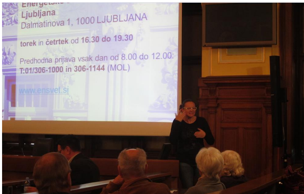
Slika 20: Utrinek s predavanja za starejše na temo trajnostnega razvoja

V obdobju, na katerega se nanaša poročilo, je MOL pozornost namenil tudi trajnostnemu razvoju in zmanjševanju energetske revščine , s katero se pogosto, med drugimi, soočajo ravno starejši. V 2016 sta bili tako v Mestni hiši izvedeni dve, iz sklopa sicer treh, brezplačnih predavanj, namenjenih posebej starejšim v okviru prejetja naziva Zelena prestolnica Evrope 2016. Prvo predavanje v sklopu je bilo izvedeno že v oktobru 2015, v sodelovanju z ENSVET in se je osredotočalo na izboljšanje energetske učinkovitosti pri ogrevanju. Drugo predavanje je potekalo v januarju v sodelovanju z Voka Snago in se je osredotočalo na pametno in trajnostno ravnanje z odpadki, vnovično uporabo stvari in odgovorno potrošništvo. V marcu 2016 je potekalo tretje brezplačno predavanje za starejše, ki so ga izvedli predstavniki Voka Snage in se je osredotočalo na odgovorno ravnanje z vodo.