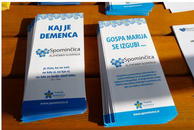
Slika 18: Publikacije, izdane v okviru sofinanciranega programa

Preko letnih javnih razpisov pa MOL redno, tudi v obdobju, na katerega se nanaša poročilo, sofinancira tudi raznolike programe s področja nasilja. MOL se močno zavzema za ničelno toleranco do nasilja ter se hkrati zaveda, da so tudi starejši vse prevečkrat njegove žrtve. Starejši pogosto doživljajo zanemarjanje (npr. odtegnitev stvari, pomembnih za življenje), psihično (zmerjanje, poniževanje, žaljenje...), ekonomsko (kraje, zlorabe bančnega računa, ponareditev podpisa, prisilen podpis pogodb...), telesno (klofuta, puljenje las itd.) in spolno nasilje. Pogosteje so nasilju izpostavljene starejše ženske. Nasilje nad starejšimi najpogosteje povzročajo osebe, ki zanje skrbijo (svojci, negovalno osebje) oziroma druge bližnje osebe (vnuki_nje, druge sorodnice_ki).