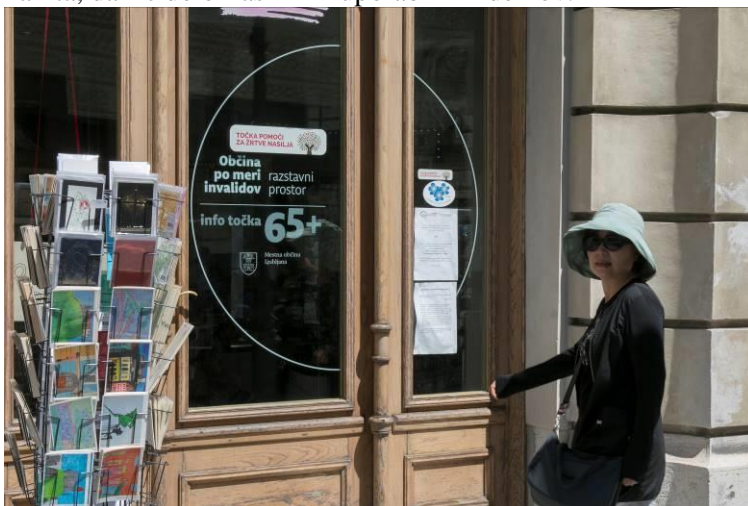
Slika 26: Vhod v Info točko 65+

V prostorih MOL, ki so bili v 2018 v celoti prenovljeni, na Mačkovi ulici 1, deluje Info točka 65+ . Info točka 65+ je informacijska točka MOL za starejše in osebe z oviranostmi. V njej deluje tudi Skrbovin'ca , kjer so naprodaj ustvarjalni izdelki odraslih s posebnimi potrebami iz varstveno delovnih centrov. Obiskovalci lahko izbirajo med drobnimi izdelki, od spominkov, nakita, darilc do okrasnih in uporabnih izdelkov.