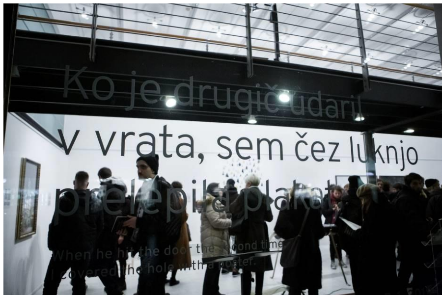
Slika 19: Razstava Ko je drugič udaril v vrata, sem čez luknjo prelepila plakat , 2018 v galeriji Kresija

prispevati k preprečevanju nasilja in zmanjšanju škodljivih posledic nasilja, k spreminjanju stereotipov in napačnih predstav o nasilju v družini in nasilju zaradi spola ter k dvigu ravni znanja in informiranosti strokovne in laične javnosti. Na prvih točkah pomoči lahko žrtve nasilja oziroma vsi zainteresirani dobijo informacije ter laično psihosocialno podporo in pomoč žrtvam. V Ljubljani so ene izmed takih točk tudi Info točka 65+, četrtni mladinski center Mladi Zmaji Bežigrad in pisarne nekaterih ČS MOL.