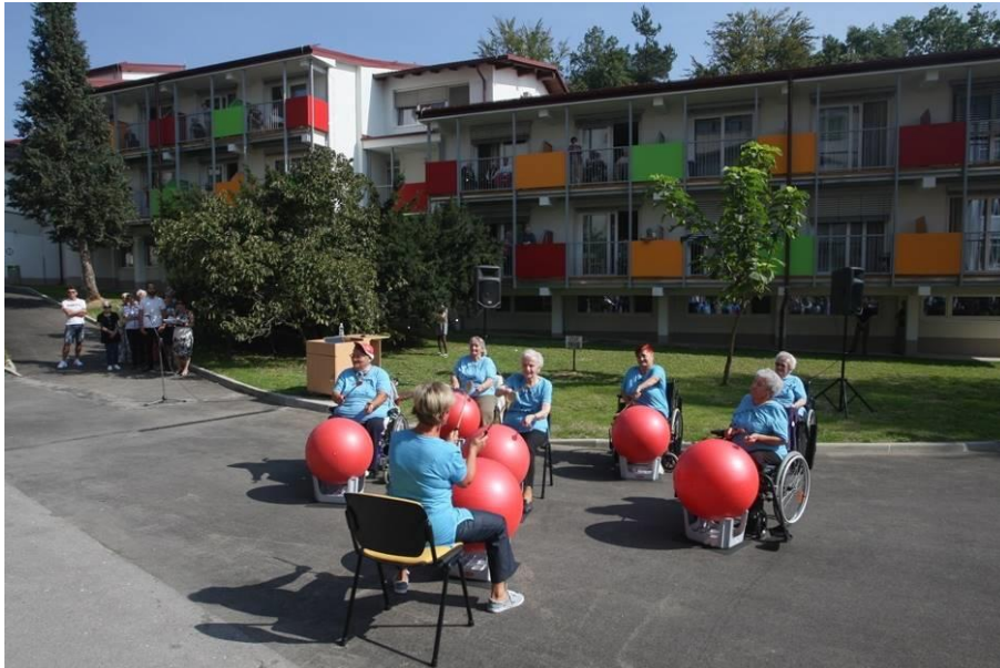
Slika 10: DSO Vič–Rudnik, Enota Bokalce

Ker se v Ljubljani že vrsto let ni zgradil noben nov javni dom, so potrebe po prostih mestih v DSO-jih višje od obstoječih kapacitet. Tudi nova enota Roza kocka DSO Center, ki se je v Dravljah odprla v letu 2020 in zagotovila 70 postelj, ni pomenilo širitve, ker se je s tem zgolj nadomestilo to, kar je bilo pred leti (ob otvoritvi Deosovega doma v Črnučah) iz že dogovorjene in v dokumentih veljavne kvote brez razloga in brez obrazložitve odvzeto. Po podatkih Skupnosti socialnih zavodov Slovenije je tako kar približno 1.500 občank in občanov MOL nastanjenih v domovih izven MOL, poleg tega pa jih še več sto čaka za sprejem. Glede na navedeno ocenjujemo, da bi v MOL, poleg obstoječih kapacitet, potrebovali dodatnih 1.500–2.000 postelj.