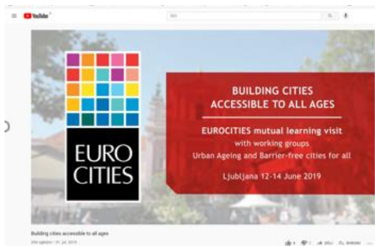
Slika 29: EUROCITIES kratek film: Building Cities Accessible to All Ages

Na podlagi navedenega so pod okriljem EUROCITIES nastale Smernice za starosti prijazna in dostopna mesta , kjer je Ljubljana zelo izpostavljena. V smernicah je Ljubljana predstavljena kot dober zgled, ki gradi na pozitivnih sinergijah med trajnostno mobilnostjo ter ohranjanjem zelenih in javnih površin. Izpostavljena je tudi kot dobitnica Evropske nagrade za zeleno prestolnico 2016, na področju prometa so izpostavljeni Kavalirji, avtobusi z nizkimi emisijami in dostopni invalidom ter prenova primestnega potniškega prometa, ki Ljubljano povezuje s sosednjimi občinami.