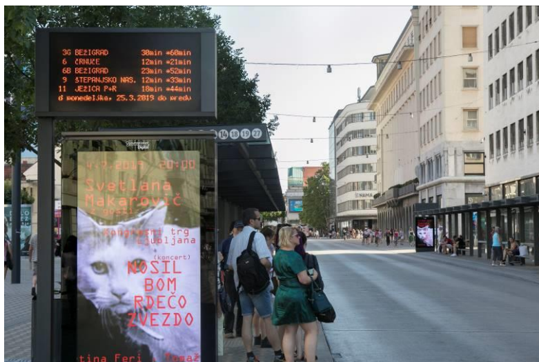
Slika 5: Prikazovalnik prihodov avtobusov LPP

MOL na postajališčih mestnega potniškega prometa zagotavlja prikazovalnike , na katerih se sproti izpisujejo podatki o prihodih avtobusov. Prikazovalnike se namešča na postajališča, kjer potnice in potniki prestopajo med linijami mestnega potniškega prometa, za njihovo delovanje pa je na samem postajališču potrebno zagotoviti tudi ustrezno infrastrukturo (elektrika, optika). Konec leta 2020 so bili prikazovalniki prihodov mestnih avtobusov nameščeni na vseh pomembnejših postajališčih mestnega linijskega prevoza.