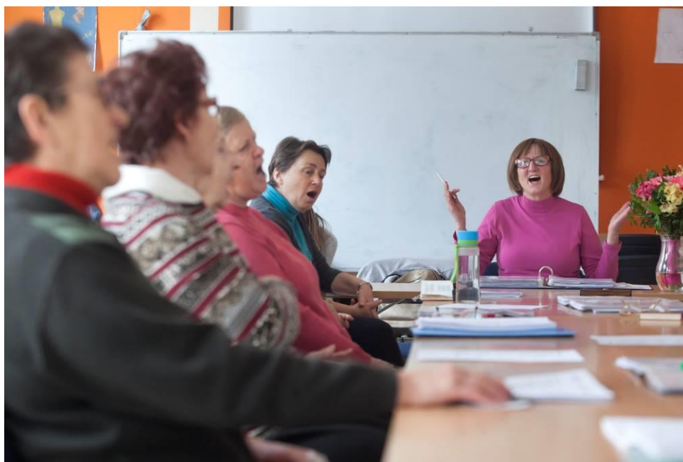
Slika 23: Utrinek iz DCA

udejanjanje svojih idej, ohranjanje lastnega ugleda in samospoštovanja, pridobivanje novih izkušenj, posredovanje v preteklosti pridobljenega znanja, širjenje socialne mreže.