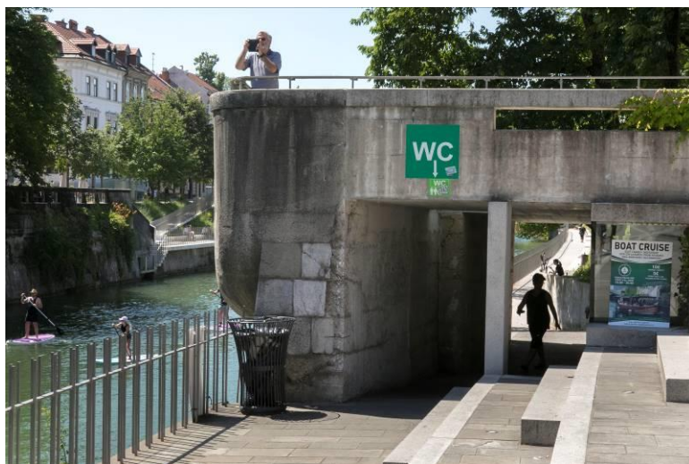
Slika 2: Dostopno javno stranišče na Bregu

Voka Snaga za MOL upravlja in skrbi za urejenost javnih stranišč na desetih lokacijah. Sedem javnih stranišč je dostopnih tudi osebam z gibalnimi oviranostmi, pod Mesarskim in Prulskim mostom, na Grubarjevem nabrežju – Špica ter na Bregu pa so tudi previjalnice. Uporaba javnih stranišč je brezplačna. Ljubljana je posebna tudi po tem, da je edina, ki v javnih straniščih uporablja najbolj trajnosten higienski papir, narejen iz odpadnega tetrapaka, kar je eden izmed mnogih projektov MOL na poti v krožno gospodarstvo. MOL je tudi že večkrat prejel nagrado za najbolj urejena javna stranišča, nazadnje v letu 2020.