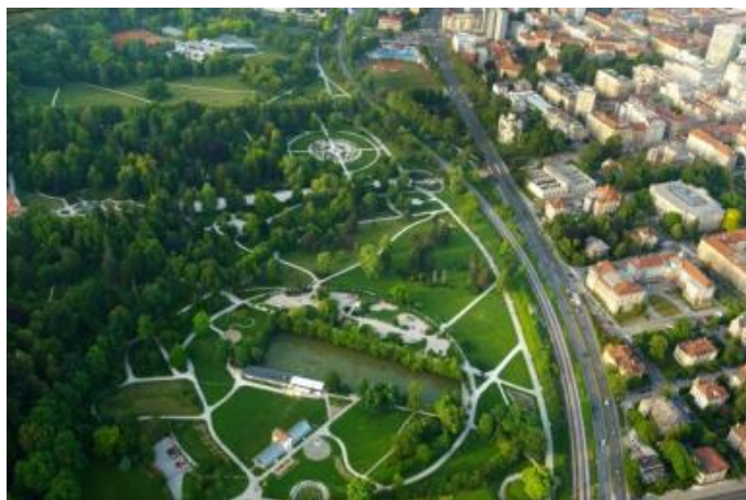
Slika 1: Park Tivoli – zelena oaza sredi mesta

Poleg gradnje vsem dostopnih novozgrajenih objektov, redno odpravljamo tudi ovire na obstoječih objektih in površinah, vključno v spomeniško zaščitenem, starem mestnem jedru. Neoviran dostop javnih površin omogočamo s poglobljanjem pločnikov in s klančinami. V mestnem središču zapolnjujemo vrzeli med granitnimi kockami in odpravljamo ovire na nivojskih prehodih. Za dostopnost zgradb MOL v javni rabi je poskrbljeno s klančinami in dvigali. Z urejanjem javnih površin in obnavljanjem stavbnih lupin izboljšujemo javno podobo mesta in dvigujemo kakovost življenja v njem. Ukrepi za zagotavljanje dostopnosti in njihovo spremljanje so večinoma zajeti v akcijskih načrtih Ljubljana – občina po meri invalidov in v poročilih o njihovem izvajanju. Z urejanjem odprtega mestnega prostora – trgov, ulic in nabrežij ter odpravljanjem arhitekturnih ovir MOL sledi razvojnim tokovom razvitih evropskih mest, izboljšuje javno podobo mesta in dviguje kakovost življenja v njem. Za vsa prizadevanja za zagotavljanje vsem dostopnega in prijaznega mesta je MOL prejel že več nagrad, tudi na mednarodnem nivoju, nazadnje na Access City Award 2018 , ko je prejel srebrno priznanje ter se s tem, na področju zagotavljanja dostopnosti mesta osebam z oviranostmi ter tudi starejšim, pridružil najboljšim v Evropi.