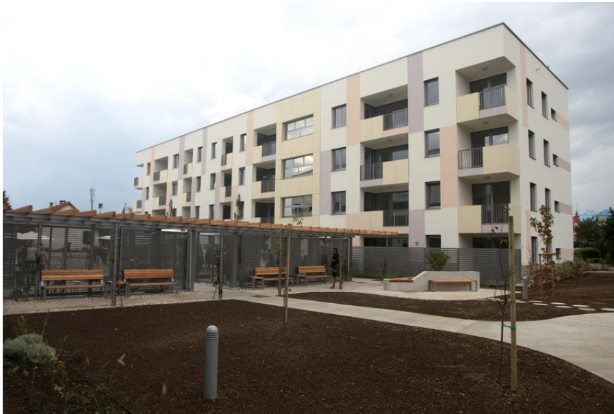
Slika 9: Oskrbovana stanovanja JSS MOL v Dravljah

JSS MOL redno in tekoče izplačuje subvencije stroškov najemnin za neprofitna najemna stanovanja in za tržna najemna stanovanja na podlagi odločb centrov za socialno delo tudi upravičenkam_cem, starejšim od 65 let.