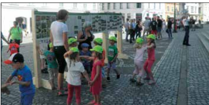
Ljubljana, Zelena prestolnica Evrope 2016. Otroci spoznavajo Barje pred Magistratom.

Prostor pred staro barjansko šolo smo uredili oziroma zasadili s trajnicami in ga poleg Sejmišča Barje tudi redno vzdržujemo (nasipamo dvorišče, kosimo travo in čistimo plevel). Člani društva porabijo za ta opravila kar veliko časa, vendar pri tem uživajo, saj se ob delu tudi zabavajo in bolje spoznavajo.