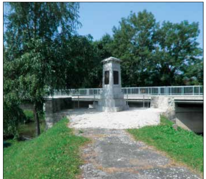
Spomenik dograditve lžanske ceste ob lščici.

Poleg projekta »Plečnikovo leto« je zelo pomembno, da v letu 2017, skupaj s Četrtno skupnostjo Rudnik in Kulturno prosvetnim društvom Barje, izvedemo svečani krajevni dogodek ob otvoritvi lani postavljenega in obnovljenega kulturnega spomenika na temeljih starega mostu čez lščico, ki je uvrščen med kulturne spomenike lokalnega pomena.