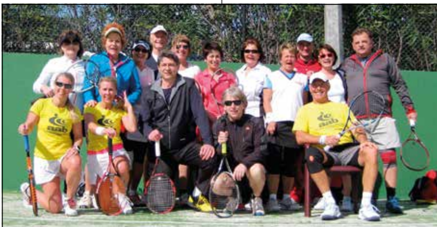
V AAB društvu smo letos izvedli tri teniške turnirje, hodili po okoliških hribih, jadrli na deski, potovali po Portugalski in šport povezali z zabavo v dobri družbi.

Največji vpliv na naravo imamo ljudje, ki smo njen sestavni del in od nje odvisni. Kar dihamo, pojemo in potrebujemo, pridobimo iz nje. Vendar se je nekaterim človeška plat izpridila in slab človek sedaj škoduje sebi in drugim z nespametnim početjem – vojna-