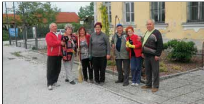
Čistilna akcija. Sedaj pa veselo na pivo.

Prostor pred staro barjansko šolo smo uredili oziroma zasadili s trajnicami in ga poleg Sejmišča Barje tudi redno vzdržujemo (nasipamo dvorišče, kosimo travo in čistimo plevel). Člani društva porabijo za ta opravila kar veliko časa, vendar pri tem uživajo, saj se ob delu tudi zabavajo in bolje spoznavajo.