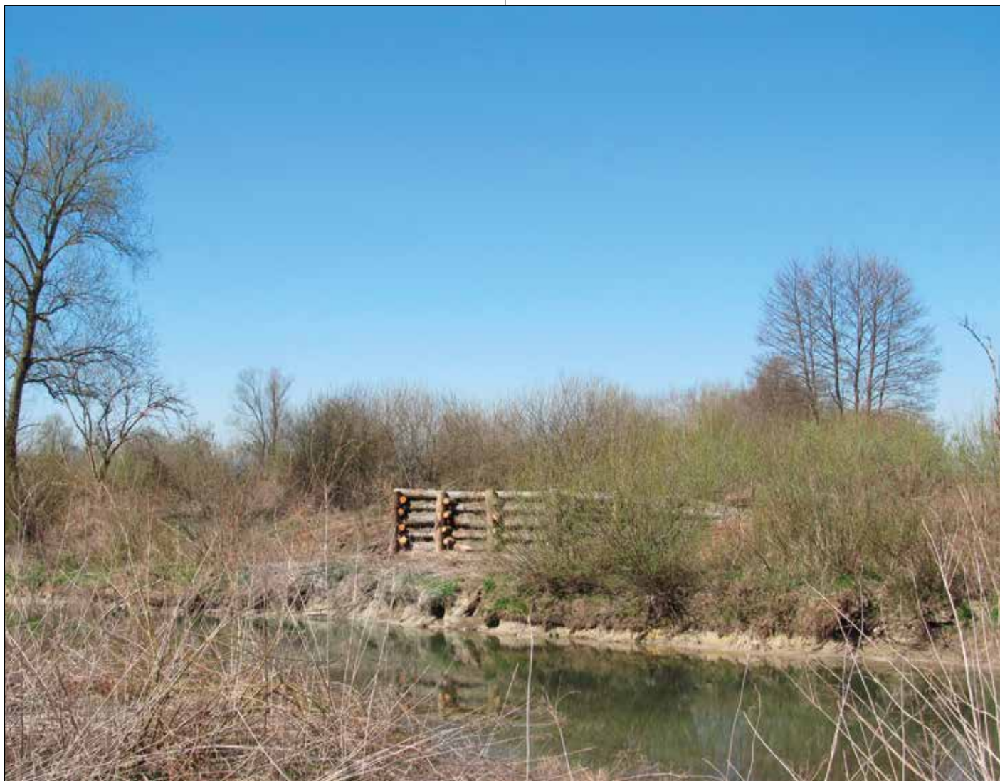
Protipoplavna gnezdilna stena za vodomca na brežini Iščice

Javno pozivamo člane Sveta ČS Rudnik, načrtovalce OPN v MOL, MOP, Javni zavod Krajinski park Ljubljansko barje, da zaščitijo ta košček Ljubljanskega barja, ga primerno opredelijo ter s tem omogočijo prednostni odkup zemljišč, sicer bomo tudi tu kmalu občudovali samo »koruzo« ali parcele s kontejnerji in žičnatimi ograjami, brez javnega dostopa do reke Iščice.