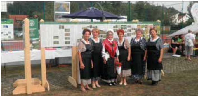
Praznik ČS Rudnik 2016. Spekle smo, pojedli so.