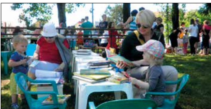
Otroške žabarije. Dobro, da je globoka senčica.