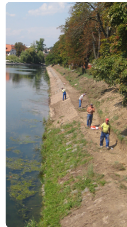
H koncu gredo dela pri obnovi obrežja Ljubljanice od Šentjakobskega mostu proti Špici.

Ponedeljek, 10. 10. 2011: 10.00 – Obisk otrok Vrta Ledina varovancev Doma starejših občanov Tabor