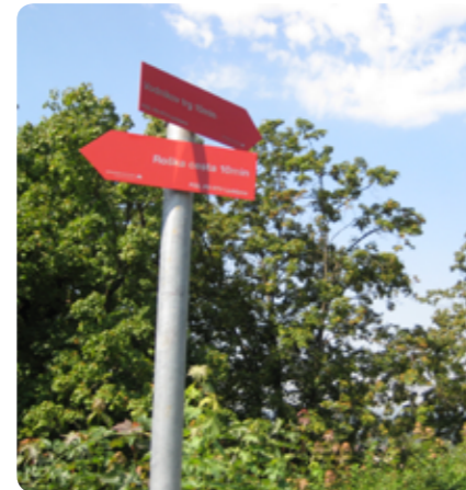
Ljubljana edina prestolnica v Evropi s planinsko transverzalo