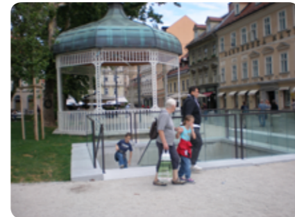
... z znamenitim paviljonom