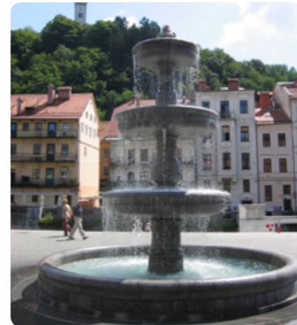
Vodnjak na Novem trgu