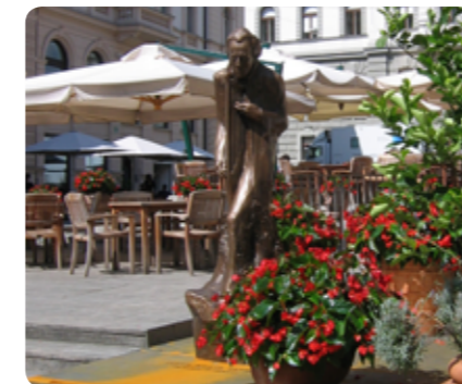
Spomenik Gustavu Mahlerju