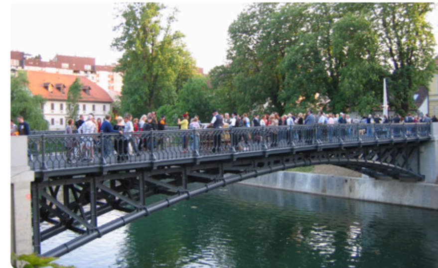
Most župana Hradeckega