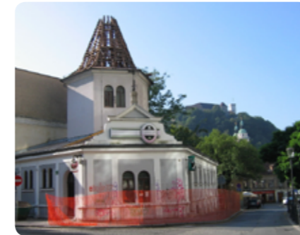
Ajdovo zrno na Mali ulici bo po novem namenjeno otrokom.