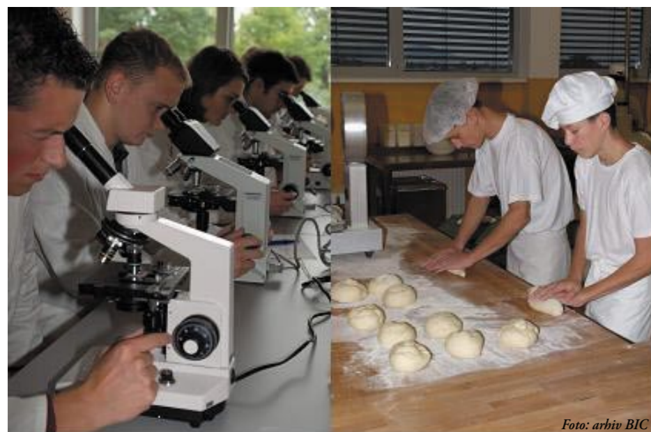
Dijaki na praktičnem pouku (peki v šolski pekarni in živilski tehniki v šolskem laboratoriju).