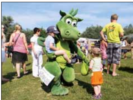
ZMAJ POMETAJ iz SNAGE nas je učil ločevati odpadke in se je hitro spoprijateljil z otroki.