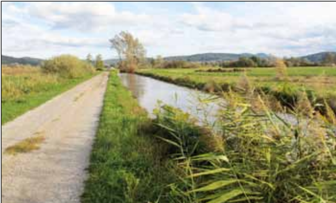
Razširjeni in poglobljeni Strojanov jarek