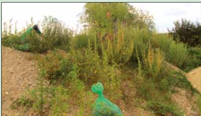
»Nasad« ambrozije na deponiji ob Galjevcu

Ob letošnjem čiščenju ambrozije v MOL – ČS Rudnik, se je med drugim ugotovila problematika »okuženih« gradbenih, komunalnih ali nasipnih deponij, kjer v večini primerov bujno vegetira zdravju in naravi nevarna tujerodna invazivna rastlina AMBROZIJA. Semena te rastline lahko obdržijo