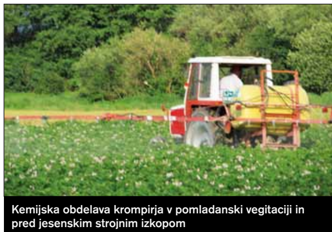
Kemijska obdelava krompirja v pomladanski vegetaciji in pred jesenskim strojnim izkopom

Ljubljansko barje je eno od področij, ko se narava skozi posamezna letna obdobja bistveno spreminja in prav zaradi tega je toliko bolj zanimiva za naključne ali redne obiskovalce. Na žalost pa je lepota, ki jo zazna oko, v določenih mesecih, lahko zelo problematična, ne samo za naravo ampak predvsem tudi za naše zdravje.