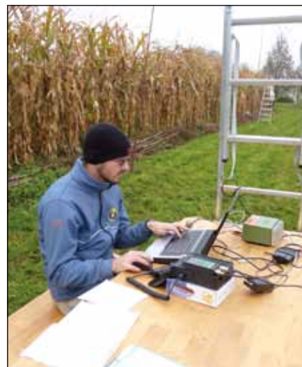
Radioamater na delu

Začetek letošnje taborniške sezone rodu Podkovani krap je bil zelo zanimiv, saj smo se že takoj na začetku odpravili na taborniška tekmovanja in akcije vseh vrst.