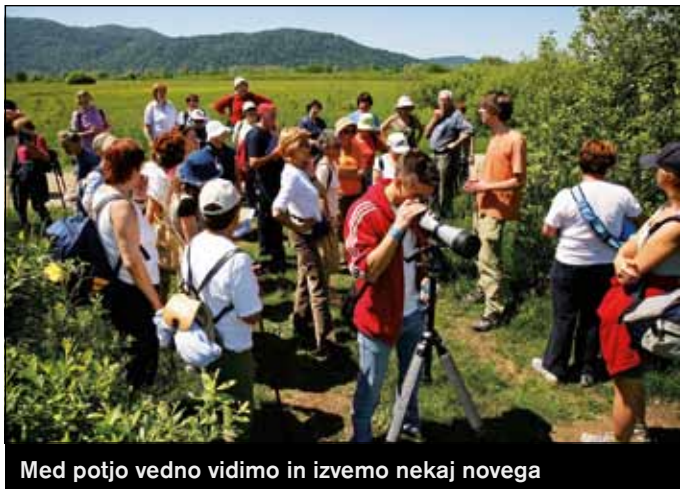
Med potjo vedno vidimo in izvemo nekaj novega