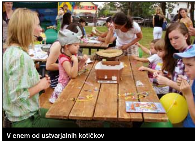
V enem od ustvarjalnih koticikov

Turistično društvo Barje je v letu 2012 izvedlo kar nekaj aktivnosti, ki so popestrile dogajanje na območju Barja (del Ljubljanskega barja, ki leži v Mestni občini Ljubljana) in širše.