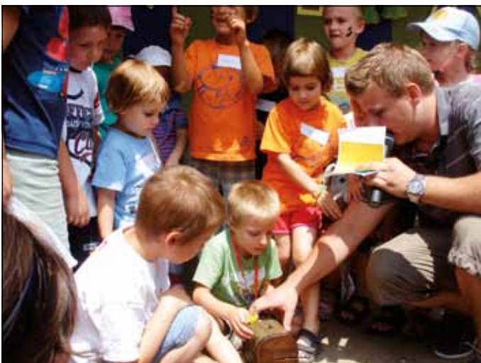
Našli smo skriti zaklad

Poleg prireditev, pa se je društvo predstavilo tudi s kulinarično ponudbo in gradivi na različnih promocijskih dogodkih od sejma Turizem in prosti čas na Gospodarskem razstavišču pa do Srečanja krajanov Četrtna skupnosti Rudnik.