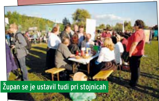
Župan se je ustavil tudi pri stojnicah