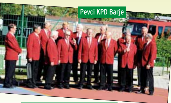
Pevci KPD Barje