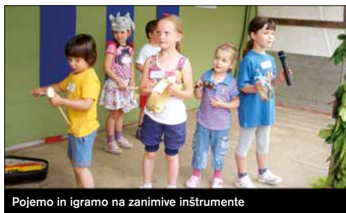
Pojemo in igramo na zanimive inštrumente