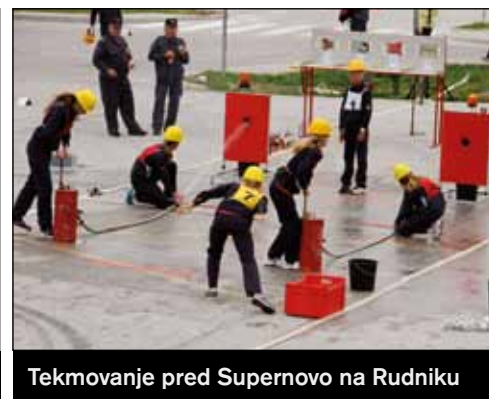
Tekmovanje pred Supernovo na Rudniku

birnem ciklusu je sodelovalo preko 15.000 otrok. Na samem tekmovanju pa je skupno sodelovalo 2.000 otrok. Na tekmovanju smo se odlično odrezali. Pionirke so osvojile 2. mesto, pionirji 3. mesto, mladinke 2. mesto ter mladinci 17. mesto. Neverjetni rezultati. Zopet smo dokazali, da je GD Rudnik skupno najboljšo društvo v Sloveniji.