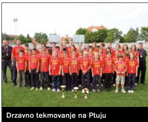
Drzavno tekmovanje na Ptuju