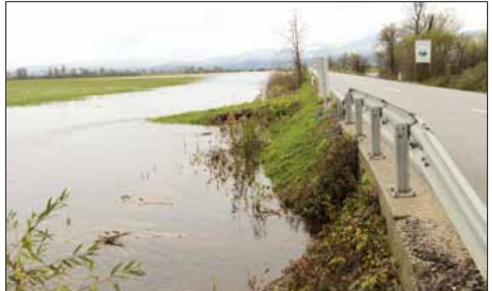
Nova naravna struga Iščice ob Ižanki

Pri saniranju nekaterih POPLAVNIH kritičnih točk v ČS Rudnik, smo bili med drugim priča čiščenja Volarja, Farjevca, Zidarjevega grabna, Iške, Šalčkovega grabna in jarka ob Črni poti. Namesto, da bi se poplavna sanacija nadaljevala s čiščenjem, predvsem pa reševanjem kritičnih točk s prepustnostjo mostu v Lipah čez Iško in v Črni vasi čez Farjavec, čiščenjem Iščice v srednjem in spodnjem toku, Izarja pred izlivom v Iščico, predvsem pa Ljubljano in Grubarjev prekop na znanih zaježitvenih točkah, se čiščenje jarkov ponovno, tako kot pred katastrofalnimi poplavami v letu 2010, »seli« na zgornje barjanske izanske in škofeljske vodotoke. Kar pomeni ponovno ogrožanje spodnje ležečih naselij; Hauptmance, Ižanska cesta, Ilovica, Črna vas in Lipe.