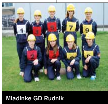
Mladinke GD Rudnik