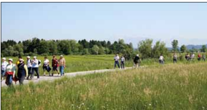
Širjave Ljubljanskega barja