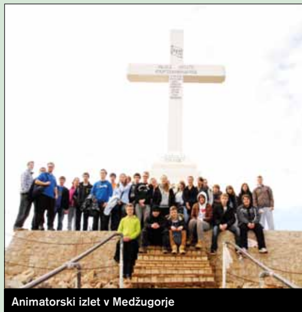
Animatorski izlet v Medžugorje

Oratorij je ustanovil znani duhovnik don Bosko v 19. stoletju. Na začetku so tam videvali fante, toda leta kasneje je bil oratorij namenjen vsem - tako fantom, kot tudi dekletom vseh starosti. Na Rakovniku tradicijo oratorija ponavljamo že dobrih 20 let. Oratorij je namenjen vsem, tudi otrokom mlajše starosti (predšolskim otrokom), za katere je lepo poskrbljeno. Oratorij traja 4 tedne v mesecu juliju.