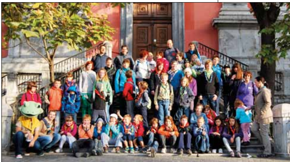
Skupinska fotografija na Fotoorientaciji