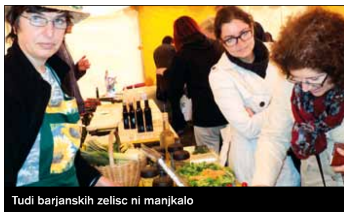
Tudi barjanskih zelisc ni manjkalo