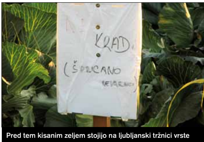
Pred tem kisanim zeljem stojijo na ljubljanski tržnici vrste