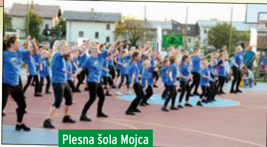
Plesna šola Mojca

Tudi letošnje druženje pred dvorano Krim na Galjevici je potekalo v prelepem sončnem vremenu. 20. septembra 2012 smo se že petič zbrali na prireditvi, kjer v organizaciji Četrtna skupnosti Rudnik in Zveze športnih društev Krim društva in zavodi predstavijo svojo dejavnost, nekateri z nastopi, drugi z izdelki.