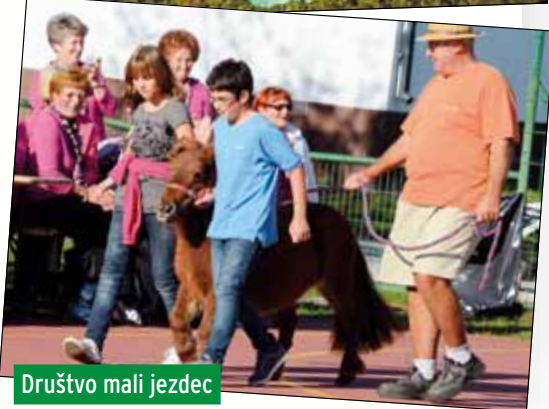
Društvo mali jezdec