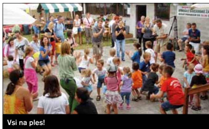
Vsi na ples!