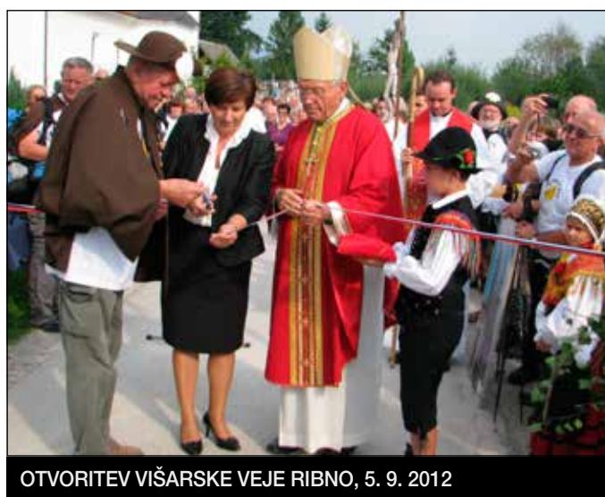
OTVORITEV VIŠARSKE VEJE RIBNO, 5. 9. 2012