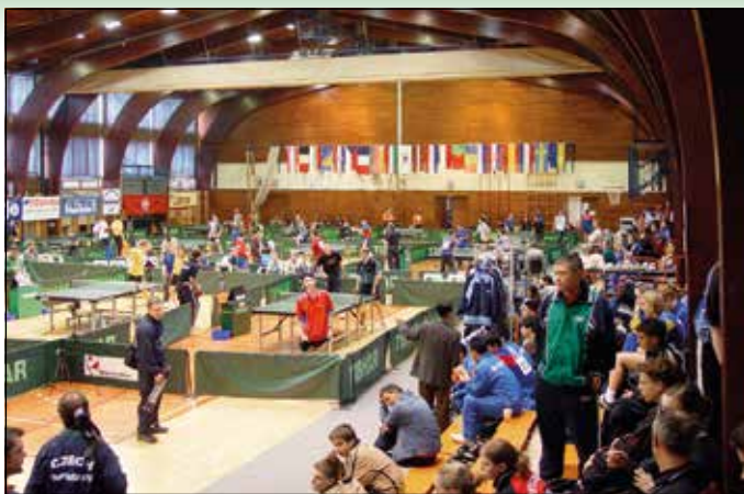
Mednarodno mladinsko prvenstvo v namiznem tenisu leta 2004