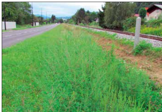
Novi »nasad« ambrozije Ob dolenski železnici, foto: arhiv ZOLB

Zato bi bila potrebna iz strani investorjev zahteva po predhodni analizi nasipnega materiala, humusa in travne mešanice, oziro-