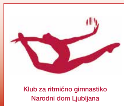
Klub za ritmično gimnastiko Narodni dom Ljubljana

trenira preko 100 deklet, starih med 5 in 25 let, v tekmovalnem in rekreativnem programu. Klub se lahko pohvali z večkratnimi državnimi prvakinjami, pokalnimi prvakinjami ter dolgoletnimi članicami državne reprezentance. Klub ima sedež Ob dolenjski železnici 50 v Ljubljani, natančneje v športni dvorani Krim na Galjevici, kjer poteka tudi vadba ritmičark Narodnega doma.