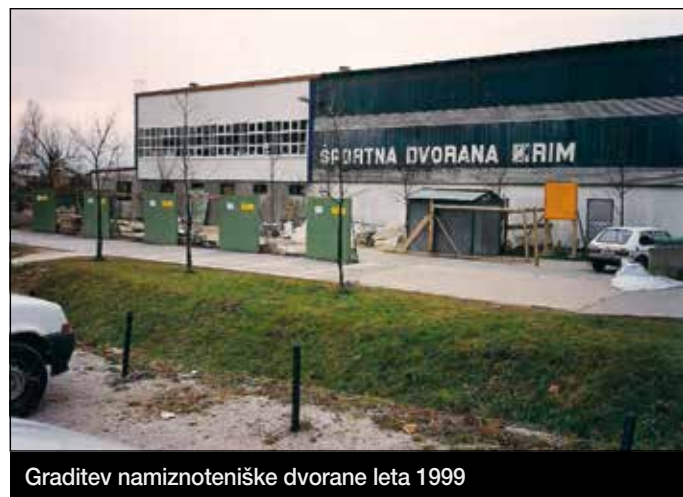
Graditev namiznoteniške dvorane leta 1999