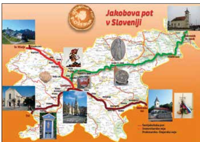
OTVORITEV DEBLA JAKOBOVE POTI V SLOVENSKI VASI 25. 7. 2012