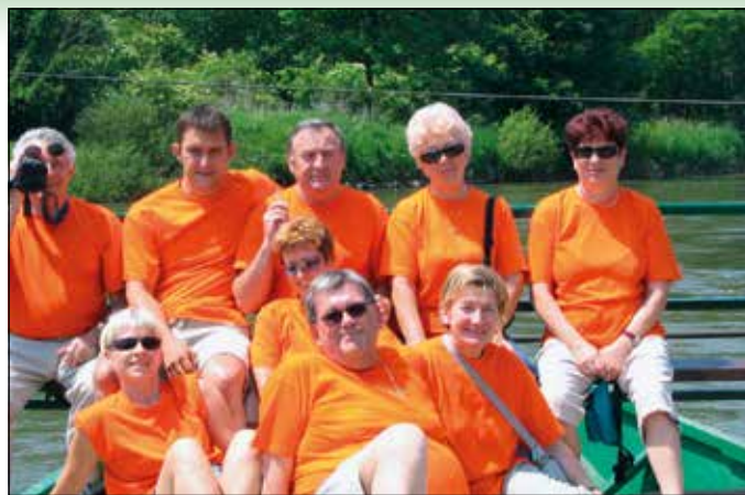
Kolektiv ZŠD Krim na izletu v Prekmurju leta 2005

Ljubljana) tako, da zveza danes šteje 15 članov/društev. Skupaj z društvi sodeluje pri dejavnostih, ki so v podporo pridobivanju članstva klubom in širjenju prepoznavanja blagovne znamke Krim ter prepoznavanja posameznih športnih panog. Društvom zveza pomaga pri reklamiranju njihove dejavnosti ter pri skupnem nastopanju na raznih dogodkih in prireditvah. Že 5 let tradicionalno, skupaj s Četrtno skupnostjo Rudnik, pripravi Dan odprtih vrat, kjer imajo vsa društva ZŠD Krim možnost predstavitve svoje dejavnosti. Prav tako nadaljuje s podeljevanjem priznanj najboljšim športnikom.