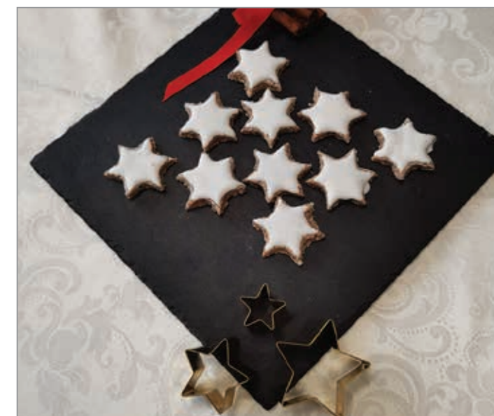
Glazura za zimski pridih