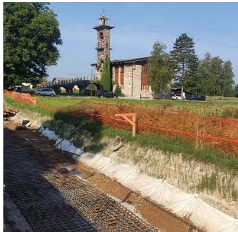
Obnova Črnovaške ceste

Dela v Črni vasi se nadaljujejo. Čeprav so stanovanjci, ki so dolgo čakali na izgradnjo kanalizacije in obnovo ceste, veseli, da so dela v teku, se v času gradnje vsakodnevno srečujejo z neprijetnostmi, ki jih povzročajo obvozne poti. Predvsem z vozniki, ki največkrat ne upoštevajo objavljenega obvoza. Če ne živite na tem delu, bodite toliko obzirni, da uporabite označeno obvožno pot, že tako ozke poti po barjanski štrdonih pa pustite v uporabo le stanovalcem.