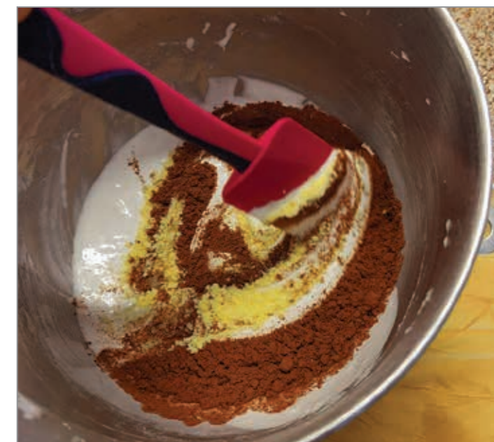
Ostale sestavine v stepeni beljak nežno vmešamo

Nasvet: Ko je testo zvaljano, ga lahko postavimo za nekaj minut v skrinjo. Tako bomo zvezdice lažje izrezali.