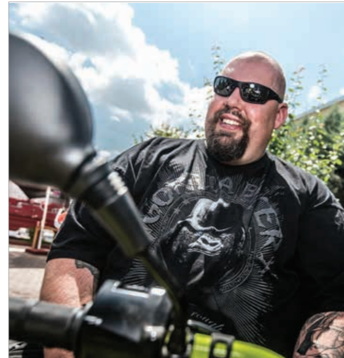
Jožetova velika ljubezen je vožnja s štirikolesnikom.

Med šolskimi počitnicami je pridno pomagal očetu v delavnici, zato mu je ta obljubil motor. Dobil je starejši BMW R 25/2 in zasvojenost s starejšimi motorji in kasneje avtomobili je postala njegovo življenje. Na srečanju starodobnikov se je nato navdušil nad M3A1 iz leta 1939. Najljubšega motorja ali starodobnika zanj ni, saj pravi, da imata vsak avto in motor svojo zgodbo, ki govori o človeku ali naravi, deželi ter času, v katerem je nastal. Poleg motorjev so ga pred leti navdušili še džipi, ki so karizmatični in se ne morejo primerjati z avtomobili. Ker se navdušuje nad novimi izzivi, se je začel udeleževati tudi dirk s starodobniki. Sedemdnevna dirka po Albaniji je bila trening za Dakar.