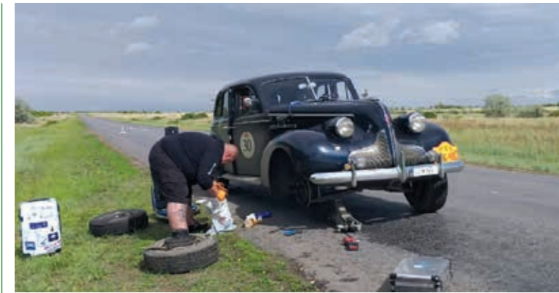
Velikokrat je morali popravljati kar sam

Na tej težki poti sta spoznala kruto in lepo stran rallyja. Kruta