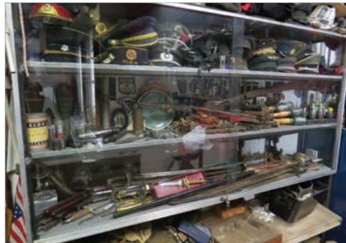
Le droben del bogatega Jožetovega arzenala

Prostora je vedno premalo, zato je kupil gospodarsko posestvo pri Velikih Laščah, ga etnološko uredil in del svoje zbirke postavil na ogled. Tam je stari toplar spremenil v muzej, na posestvu postavil nekaj lesenih lop in lično obnovljeno staro hišo. Na dvorišču stoji celo manjše letalo. Posebej ponosen pa je tudi na svoj zeleni vojaški motor Moto Guzzi Nuovo Falcone , ki je prišel iz Nove Gorice.