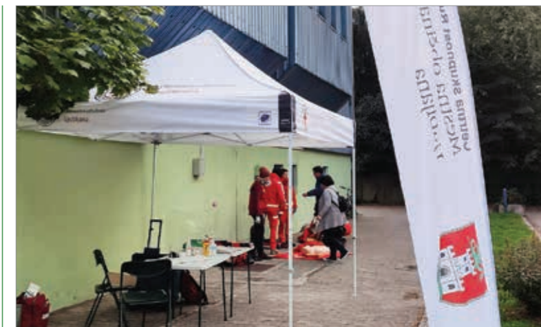
Slovenija oživlja, RK Slovenije OE Ljubljana

Prvi, ki so izkoristili možnost, so bili iz Rdečega križa, ki so v sklopu akcije Slovenija oživlja prikazali temeljne postopke oživljanja. Zastoj srca, ki se zgodi izven bolnišničnega okolja, je najpogostejši vzrok smrti v razvitih državah. V Sloveniji v povprečju vsak dan 4 osebe doživijo srčni zastoj. Kar 60% srčnih zastojev se zgodi doma. Najverjetneje boste oživljali svojca, prijatelje, sodelavce. Bi znali pomagati?