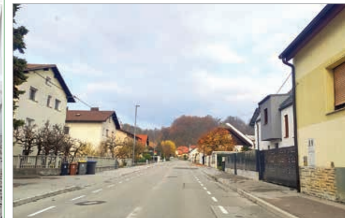
Kolesarska steza na Orlovi ulici dobiva pravo podobo.

Po četrtini skupnosti se nadaljuje označevanje kolesarskih stez.