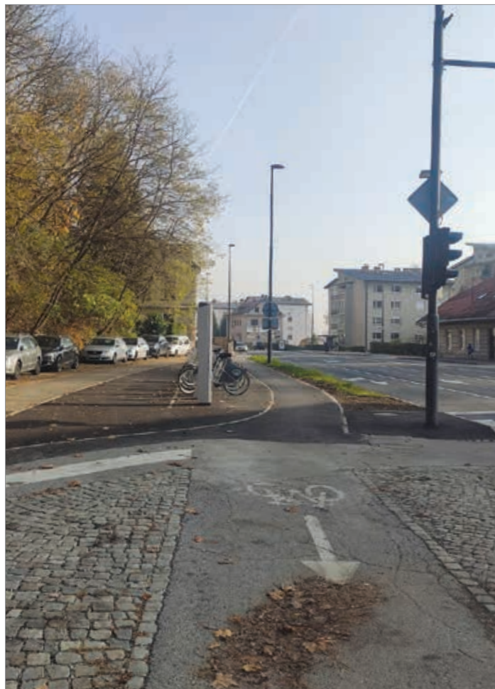
BicikeLJ pri Strelišču

Pri Strelišču je postavljena nova postaja BicikeLJ. Vse kolesarje prosimo, da upoštevajo cestno prometne predpise in naj vozijo kulturno in strpno. Na strpnost in umirjeno vožnjo opozarjamo tudi vse kolesarje, ki se vozijo po gozdnih poteh, kjer si pot delijo pešci, kolesarji in avtomobili. Še posebno pa po prijatih pritožbah ponovno opozarjamo gorske kolesarje, ki se peljejo iz smeri trailov, da po ulicah in naseljih vozite z močno zmanjšano hitrostjo. Svoje znanje in močna kolesa raje pokažite na trailih in na tekmovanjih!