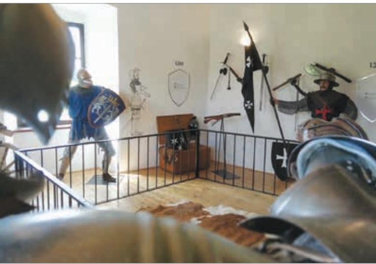
Scenska postavitev v graju Turjak

v zgodovino in slovensko kulturo pa je sprejel izziv in s svojo ekipo počasi začel prenavljati, obnavljati in opremljati Turjaški grad. S pomočjo Ministrstva za kulturo, občine in občanov so grad letos odprli za javnost. Lastnik gradu, po katerem je dobil ime Turjaški, je bil Herbart Turjaški - goreč sovražnik Turkov.