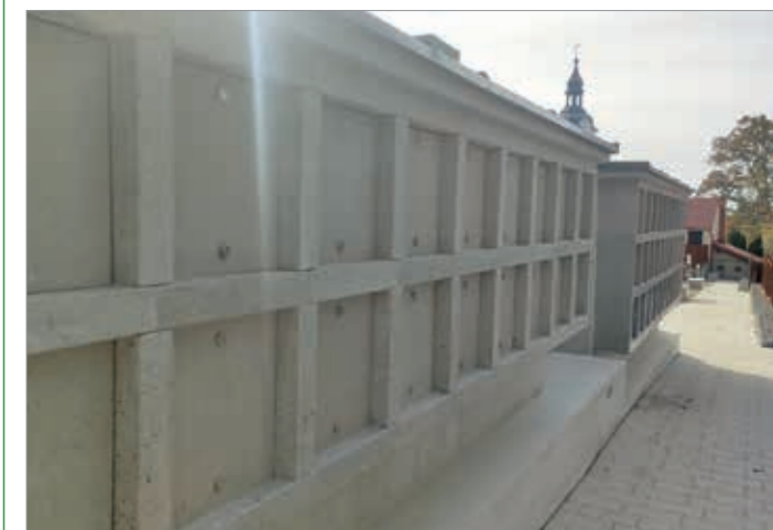
Novi žarni grobovi