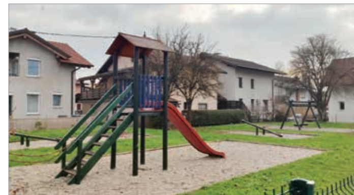
Sanirano in obnovljeno otroško igrišče na Voduškovci

Čeprav se v četrtini skupnosti trudimo dobiti kakšno novo otroško igrišče, smo veseli tudi obnove obstoječih!