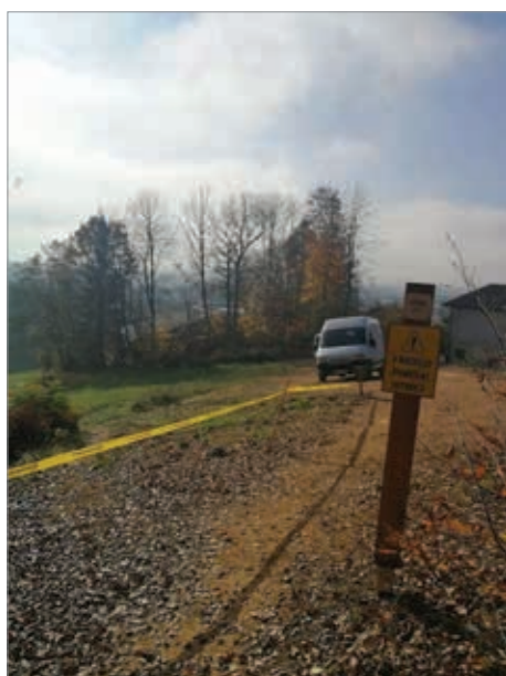
Opozorilo Golovec trails

Pri Strelišču je postavljena nova postaja BicikeLJ. Vse kolesarje prosimo, da upoštevajo cestno prometne predpise in naj vozijo kulturno in strpno. Na strpnost in umirjeno vožnjo opozarjamo tudi vse kolesarje, ki se vozijo po gozdnih poteh, kjer si pot delijo pešci, kolesarji in avtomobili. Še posebno pa po prijatih pritožbah ponovno opozarjamo gorske kolesarje, ki se peljejo iz smeri trailov, da po ulicah in naseljih vozite z močno zmanjšano hitrostjo. Svoje znanje in močna kolesa raje pokažite na trailih in na tekmovanjih!