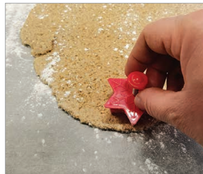
Uporabite izrezovalec z vzmetjo